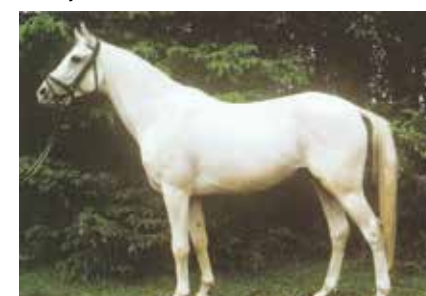
Bajar (sz.: 1969 Suakim x Gazelle I)

a kitűnő eredményt. A következő nemzetközi tenyészszemléken is sikerült igazolni, hogy az újjáépítés feladata kiválóan sikerült. Egyébként valamennyiünk számára megdöbbentő erejű felismerés volt, hogy az egyiptomi arab telivérekkel „nemesített” vékony, keskeny, sekély, hosszúlábú kancákból a kiváló mének után már sokszor az első, de a második generációban már egészen biztosan kiváló, imponáló küllemű shagya egyedek születtek. Ez a tény azt mutatta meg, hogy az évszázadokon át végzett szakszerű tenyésztői munka rendkívül értékes volt és néhány generációs átgondolatlan párosítással ennek az eredményét nem lehetett tönkre tenni.”