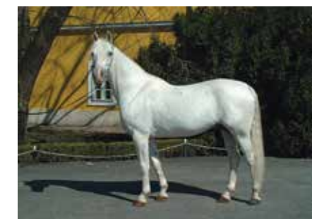
Nagycsere Shagya 138 Impala / Shagya V (sz.: 1995 Shagal/Shagya V x Farag II-7)

Egy fajta fenntartásához legkevesebb 100-120 fős, egységes szempontok alapján fedezettett minőségi kancaállomány szükséges. Célunk az volt, hogy a génmegőrzés munkáját, felelősségét és költségeit ne csak egy állami ménes vi-