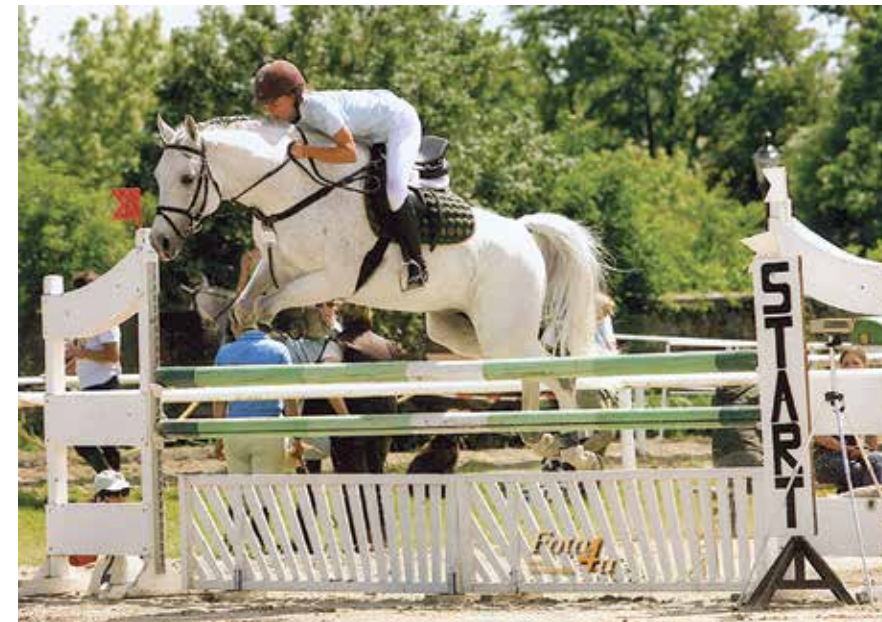
Csillag / O'Bajan XXII (sz.: 1993 Pamino/ O'Bajan XX x Csárdáskirálynő)

kon a díjlovaglásban és díjugratásban jeleskedő kiváló mozgású, nagy rámát örökítő, de kissé durva mént. Megtört