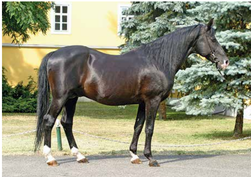
Batan / O'Bajan XVIII (sz.: 1984 O'Bajan XIII-1 x O'Bajan I-17)