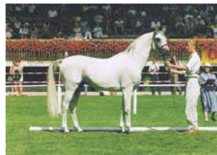
Pamino / O'Bajan XX (sz.: 1980 Bajar x Pamina)