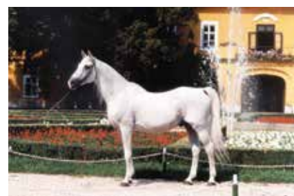
Balaton / Gazal XIII (sz.: 1972 Gazal VII x O'Bajan XIII-12)

Nagy segítséget jelentett, hogy Bruno Furrer segített megtalálni és bennünket összekötni a Batan nevű fekete O'Bajan mén tulajdonosával. A fekete színű és tipikus O'Bajan alkatú Batan apja a híres Knie Cirkusz „művésze” volt, és származásának harmadik ősi sorában háromszor található a kiváló alkatú és a törzs minden jellegét magán viselő O'Bajan X törzsmén neve. Így nem csoda, hogy Batan csikói között megjelentek a törzsre jellemző színű és alkatú méncsikók.