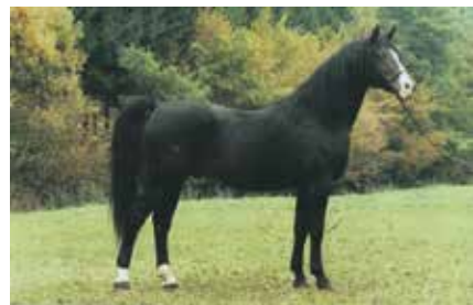
Bartok (sz.: 1971 Gazal VI x O'Bajan XIII-12)

színvonalra emelt. Megtetszettek neki a kecses arab telivérek és érzékelték, hogy az arab telivérnek Amerikában is óriási értéke van. Innen importált telivér ménekekkel keresztezte át a bábolnai erőteljesebb állományt. Ezzel a fajta elvesztette két legértékesebb tulajdonságát, egyrészt azt, hogy rendkívül nemes megjelenése mellett egészséges méretekkel rendelkezik, így kiváló alkata és kitűnő mozgása révén hátsó és fogatos használatra is kiválóan alkalmas, de azt is, hogy más fajták nemesítésére kiemelkedően használható.