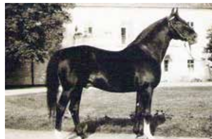
O'Bajan X (sz.: 1929 O'Bajan VII x 36 Shagya VII)

1990 júniusában meghívták Bábolnára az ISG vezetőit egy közös tenyészszemlére, hogy a pontos állapotfelmérés után közösen tervezzék a ménes minőségének helyreállítását.