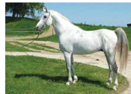
Mersuch XXII-8 / Mersuch IX (sz.: 1992 Mersuch XXII x KoheilanXXXIII-18)