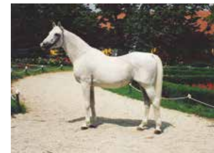
Paris / Gazal XIX (sz.: 1985 Bartok x Pamina)