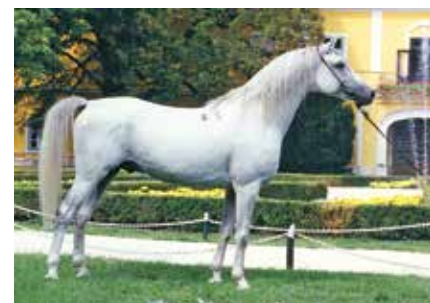
Gazal XIII-10 / Gazal XVIII (sz.: 1995 Gazal XIII x 76 Shagya XLIII)