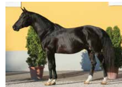
Shahim des Charmes / Gazal XXV (sz.: 2011 gazal Golyó x 59 Amurath Sziena)

A '90-es évek elején többen fogtak tenyésztésbe, részben Bábolnán vásárolt