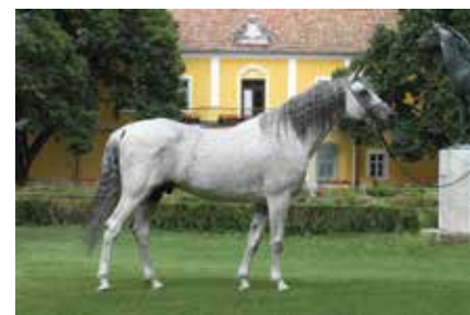
Osama / O'Bajan XXXI (sz.: 2003 Occident x Remira)

Ahol a tenyésztők saját, olykor felszínes ismereteik alapján kezdenek a tenyésztésbe, bizony nagyon kérdéses az előrehaladás mértéke.