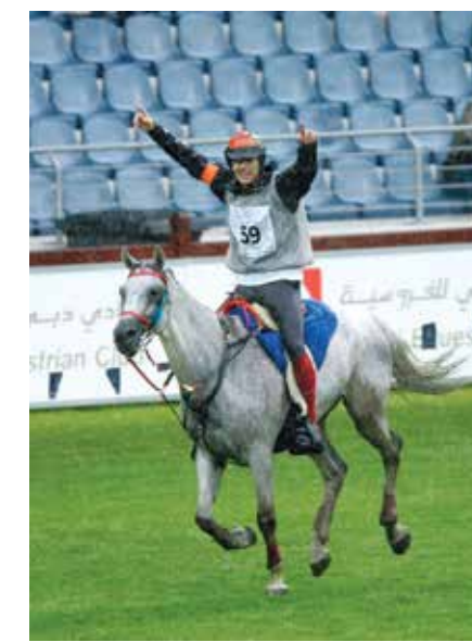
Hungares (sz.: 1998 Siglavly Bagdady VIII x 252 Kánya) herélt