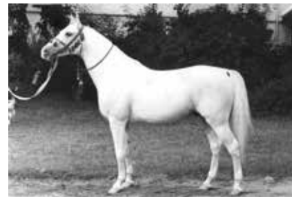
Shagya XXXVI (sz.: 1948 Shagya XXXII x 154 Shagya XXV-2)