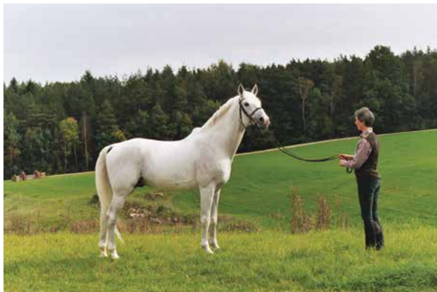
Saphir I / Shagya II (sz.: 1985 Shagya XXXIX-11 x Gazal VII-2)

selje, hanem legyen egy olyan tenyésztői kör, mely a közös cél érdekében hajlandó az együttműködésre, és vállalja, hogy egy-egy méntörzset, kancacsaladot kiemelten kezel. Sajnos alig kezdtünk ennek megvalósításához a ménésben 2008-ban kezdődő személyi változások sorozata ezt a munkát zárójelbe tette. A piac érzékenyen reagált a változásokra. Elrettentő példa erre a lengyel ménesek helyzete, amikor a két vezető ménes, Janow Podlaski és Michalow igazgatóját politikai megfontolásból leváltották, az addig sikeres őszi árverésük 4 millió Eurós forgalma két éven belül a tizedére