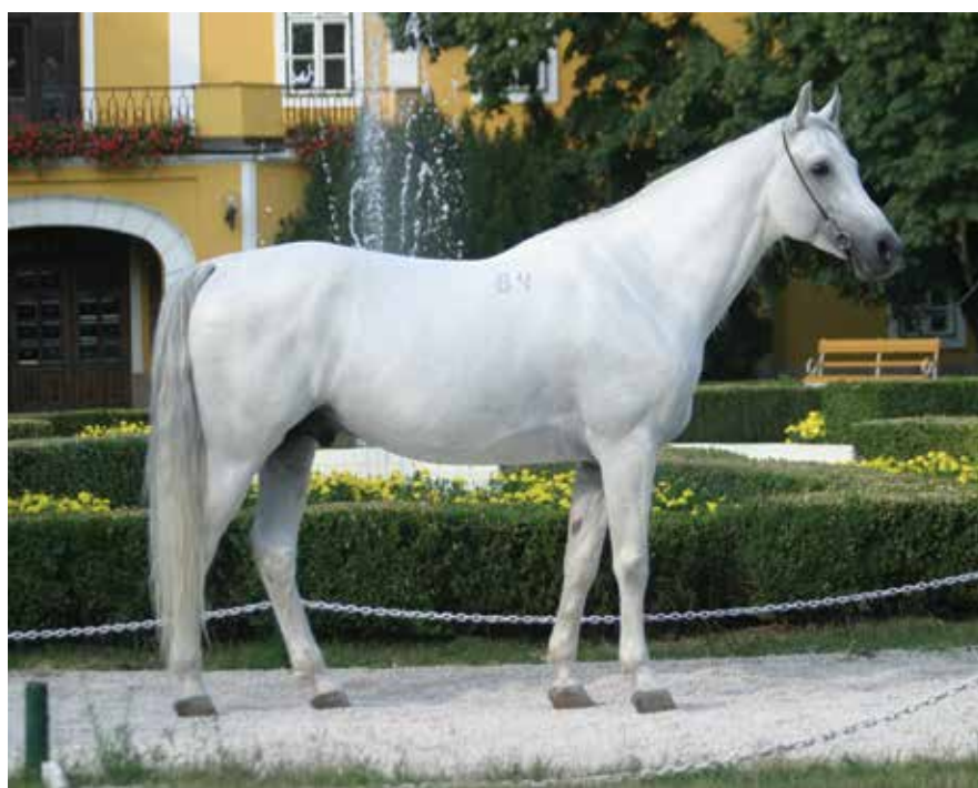
Shagya VI (sz.: 1994 Shagal/Shagya III x 162 Amer)

esett vissza! A génmegőrzés fontosságát a polgári kormányzat kiemelten kezeli, így ez évben a harmadik ciklusban volt módjuk a tenyésztőknek támogatásra pályázni, ez esetünkben lassítja a fajta erózióját. A Bábolna Nemzeti Ménesbirtok számára olyan gazdasági háttérrel biztosított, mely hosszútávon lehetővé teszi, hogy zord piaci környezetben is a tenyésztést szolgálhassa. Dél-Tirolból Osama (O'Bajan XXXI tm.) bérletével, majd Shahim des Charmes (Gazal XXV tm.) megvásárlásával a Shagya arab tenyésztésben léptünk előre, míg Pagur (Koheilan XVII