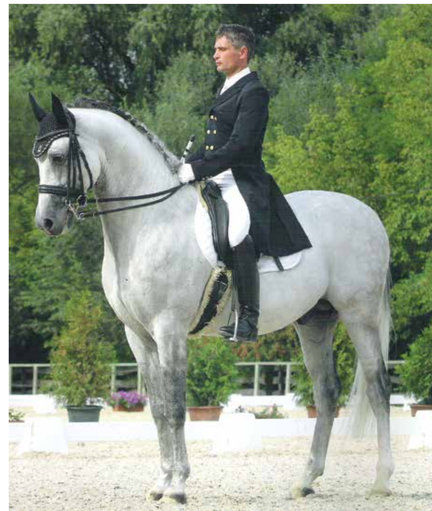
Ncs O'Bajan Pamir / O'Bajan XXX (sz.: 1999 O'Bajan XX x Aydana)