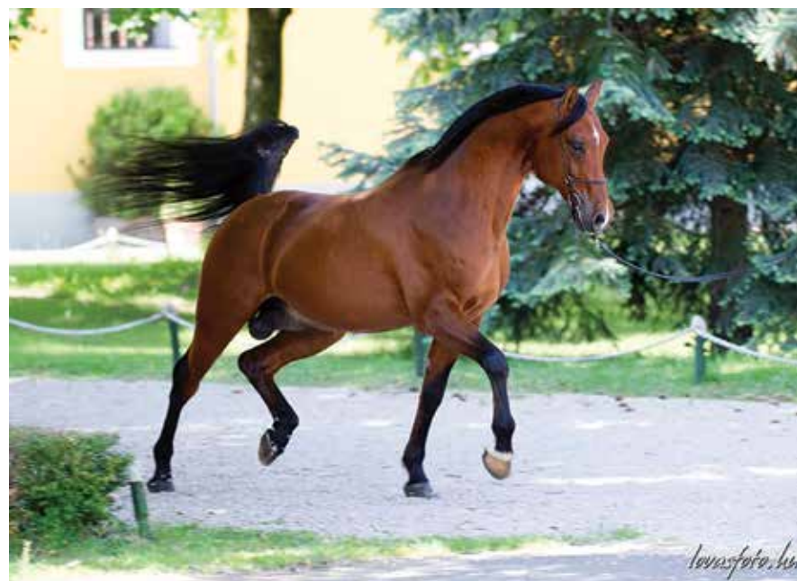
Koheilan Koppány P / Koheilan XV (sz.: 2005 Koheilan XIII x 27 Siglavy Bagdady XVI-2)

Szélesre tártuk Bábolna kapuit, feladat volt, hogy engedjünk a „birodalmi gögből”, segítsük az éledező magántenyésztést, hiszen a fajta megőrzése csak széles tömegbázisra alapozott erős